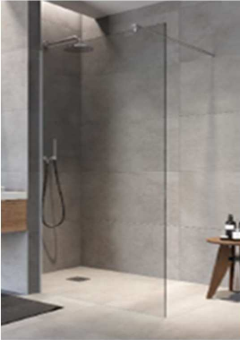
Douchewand MacBath Glasgow 880 x 2000