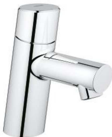
Grohe Fonteinkraan Concetto