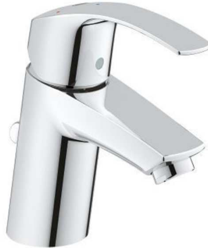
Grohe Wastafel mengkraan Eurosmart ES met waste