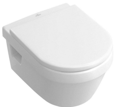
Villeroy & Boch Zwevend toilet en zitting Architectura wit