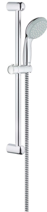
Grohe Glijstangset Tempesta II 60 cm