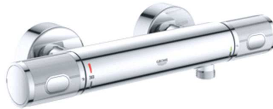
Grohe Thermostaatkraan 1000 Performance chroom