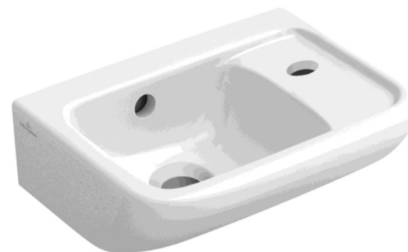
Villeroy & Boch Fonteincombinatie Architectura wit en plugbekersifon chroom met muurbuis en rozet