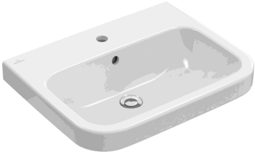
Villeroy & Boch Wastafel Architectura 60 x 47 cm wit met bekiersifon chroom met muurbuis en rozet.