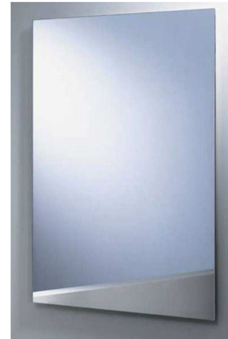
Spiegel 60 x 80 cm met verdekte bevestiging