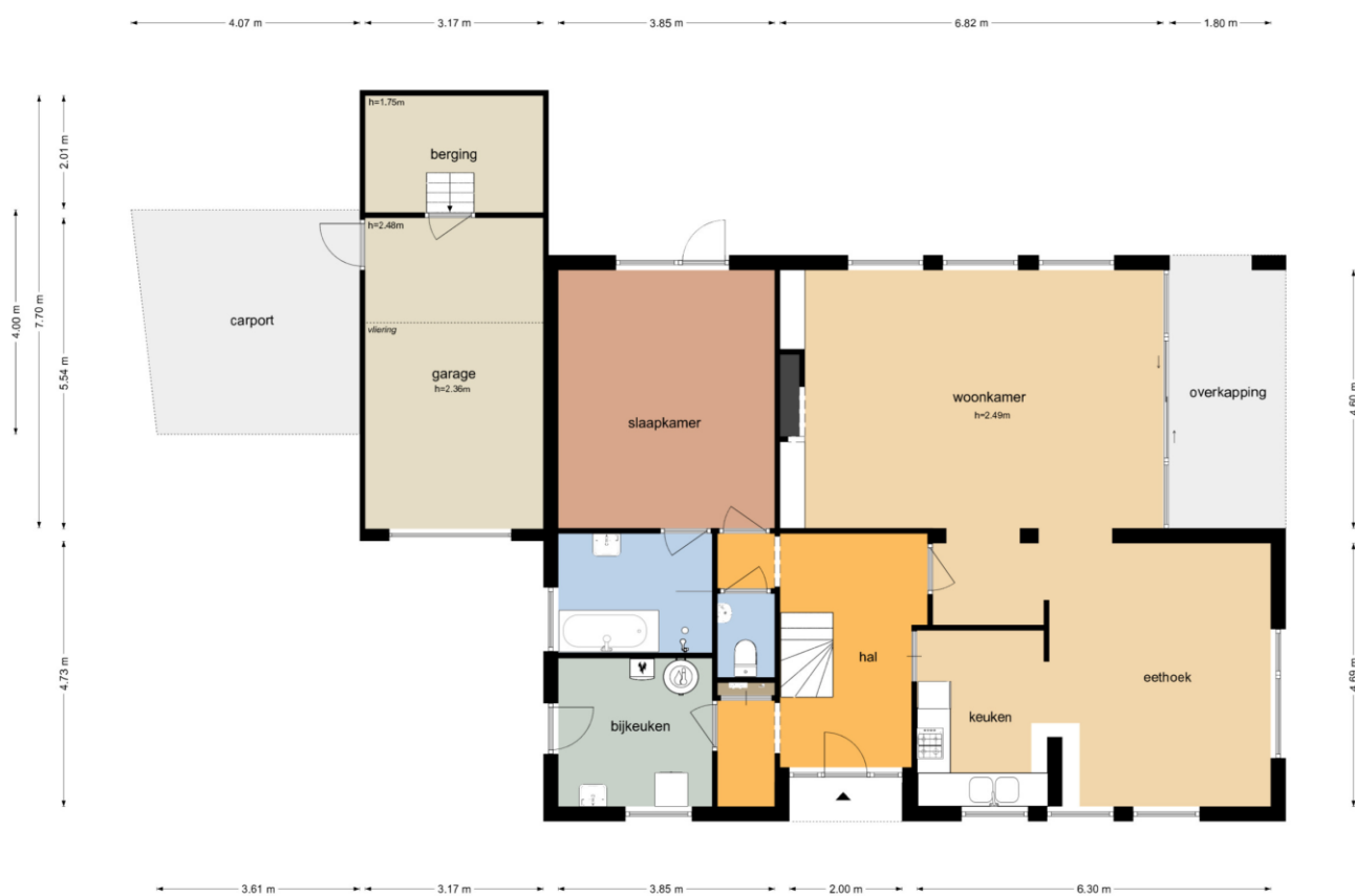
Dokkumlaan 13 - Arnhem Begane Grond

De plattegronden zijn geproduceerd voor promotionele doeleinden en ter indicatie. Aan de plattegronden kunnen geen rechten worden ontleend.