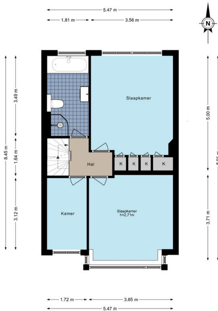
Graaf Aelbrechtlaan 106 - Amstelveen Eerste verdieping

De plattegronden zijn geproduceerd voor promotionele doeleinden en ter indicatie. Aan de plattegronden kunnen geen rechten worden ontleend. © www.woningmedia.nl