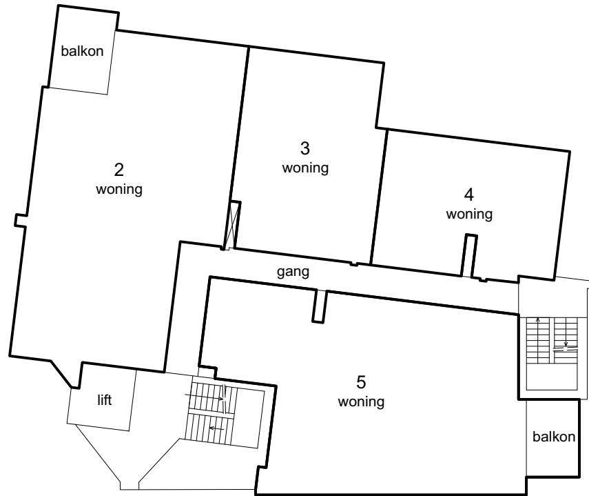
Plattegrond 1e verdieping Schaal 1:200