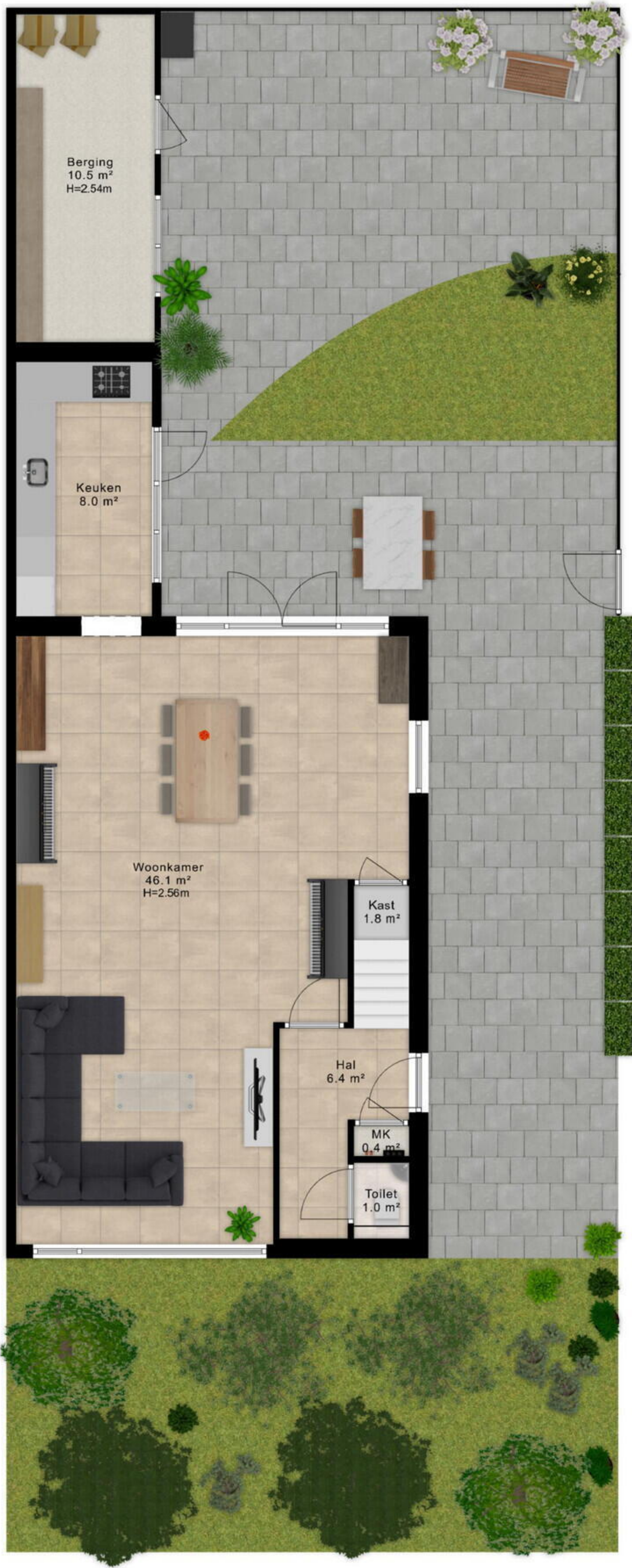
- Vastgoed fotovideo - Maatvoering is indicatief ter inzicht. Hieraan kunnen geen rechten ontleend worden.