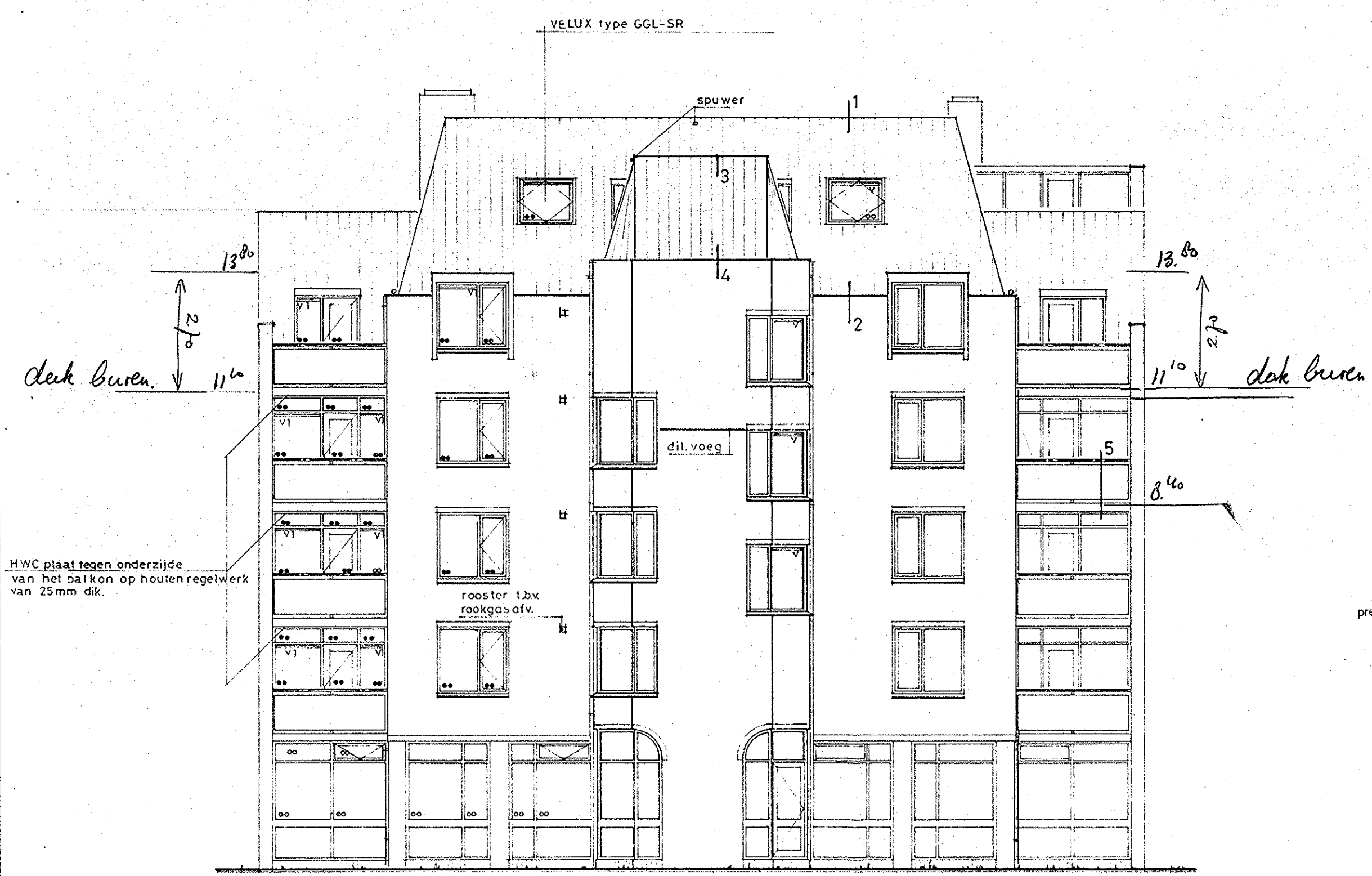
ZUID - WESTGEVEL

•• dubbelglas 6-12-10 v1 = suskast optima type 2015