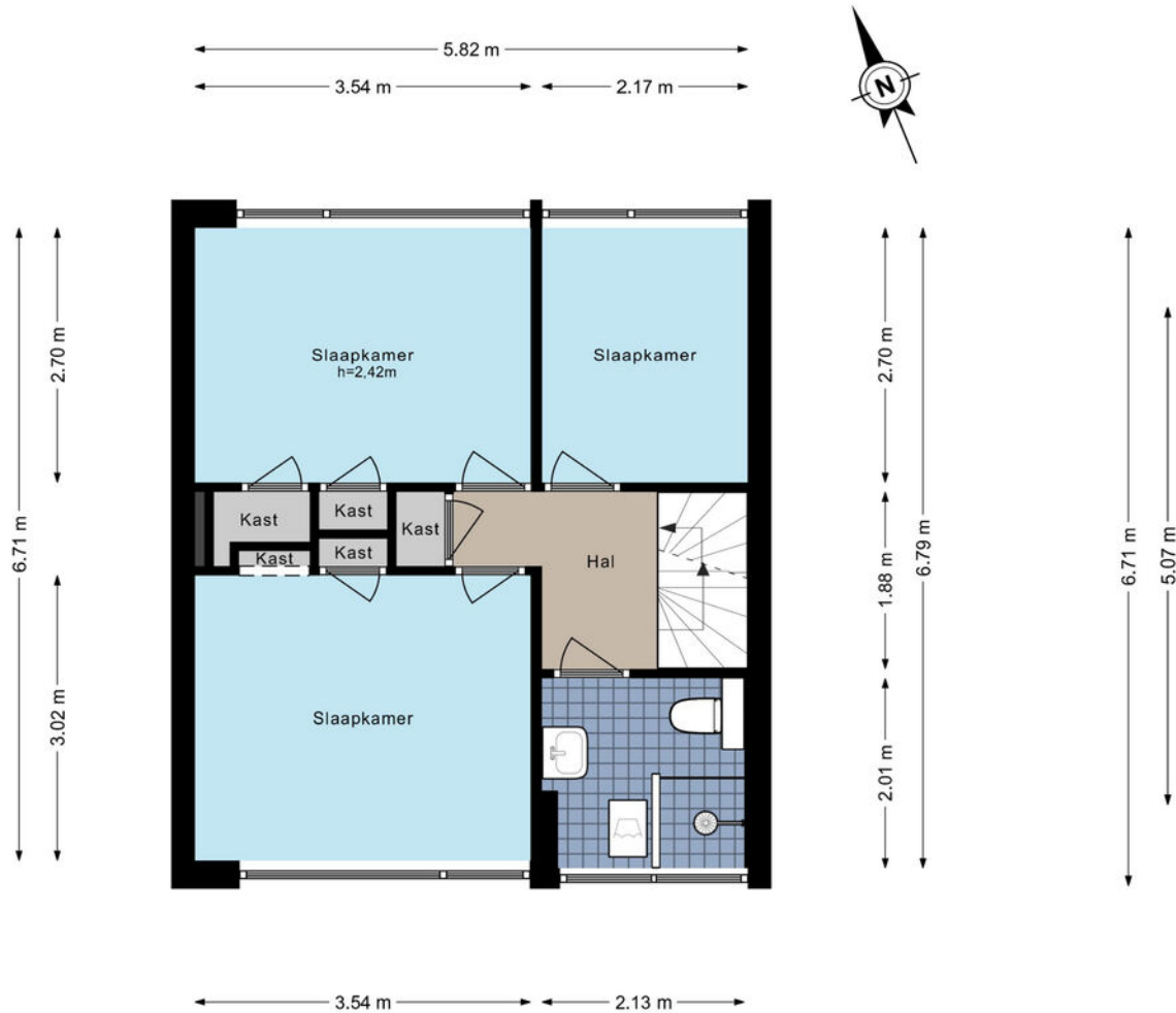
Vierlingsbeeklaan 74 - Amstelveen Eerste verdieping