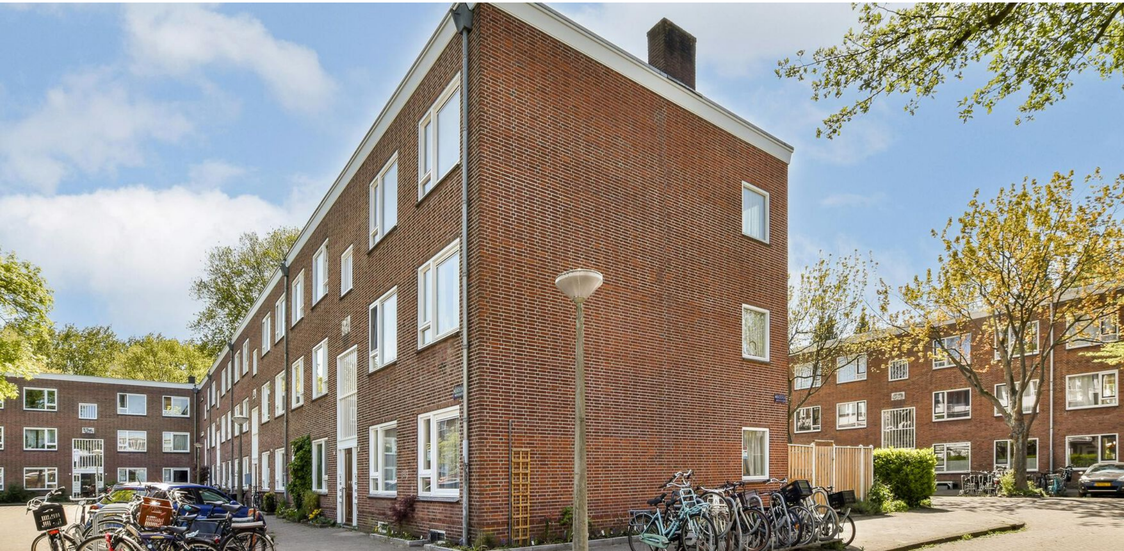
Mendelhof 1 2 Amsterdam