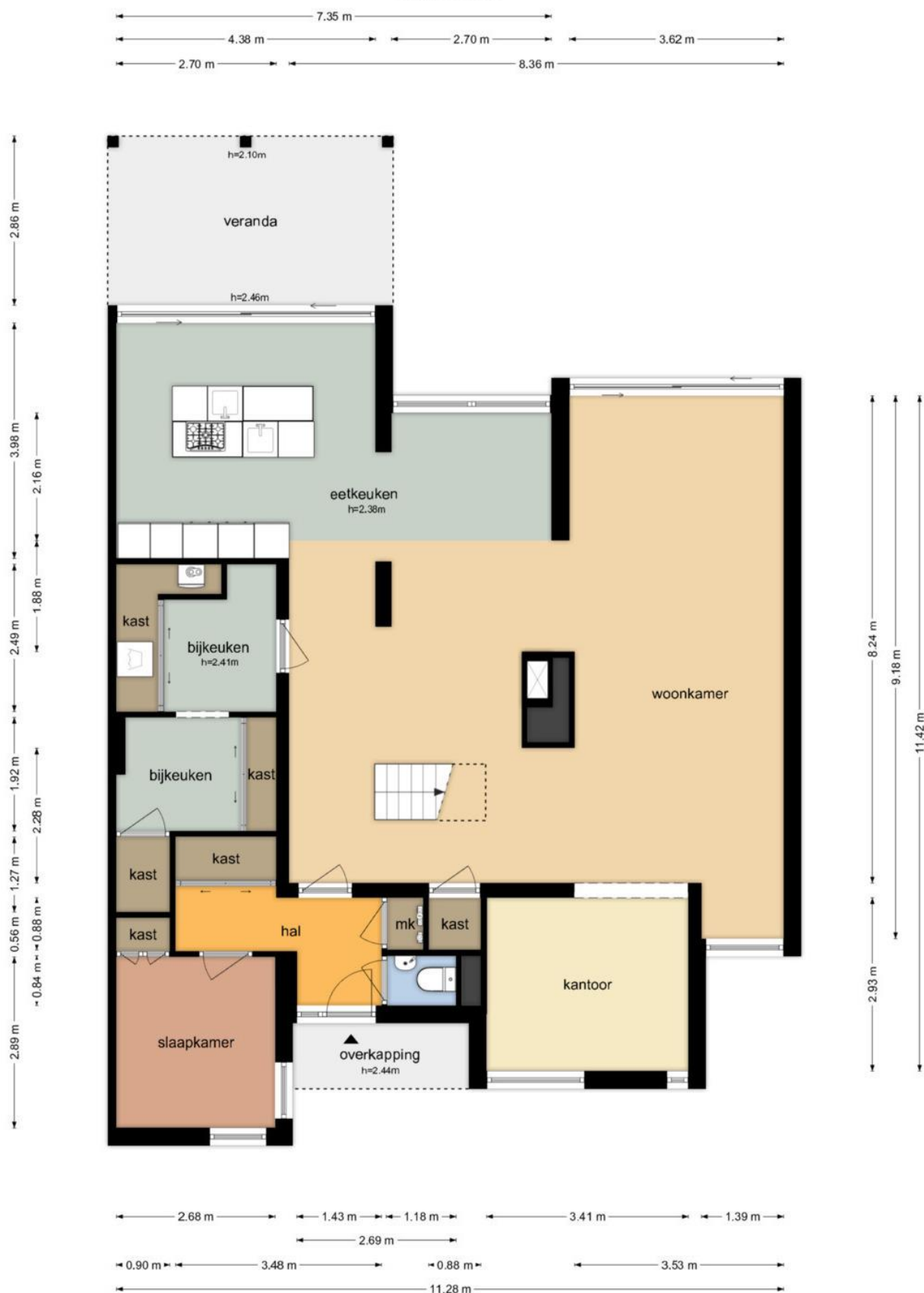
Tweelo 23 - Meppel Begane Grond

De plattegronden zijn geproduceerd voor promotionele doeleinden en ter indicatie. Aan de plattegronden kunnen geen rechten worden ontleend. © www.objectenco.nl