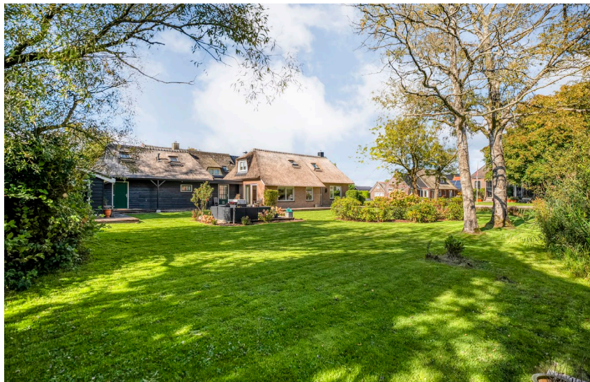
WOONBOERDERIJ AAN HET WATER