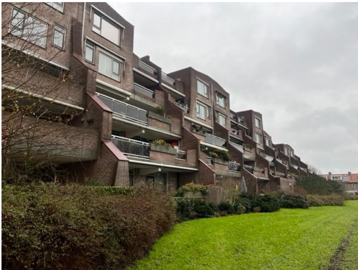
Figuur 12, overzicht achtergevel met dakterrassen