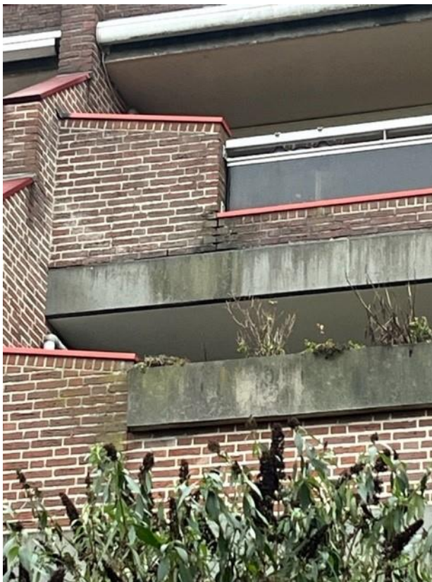
Figuur 11, uitgespoeld voegwerk met vervuiling