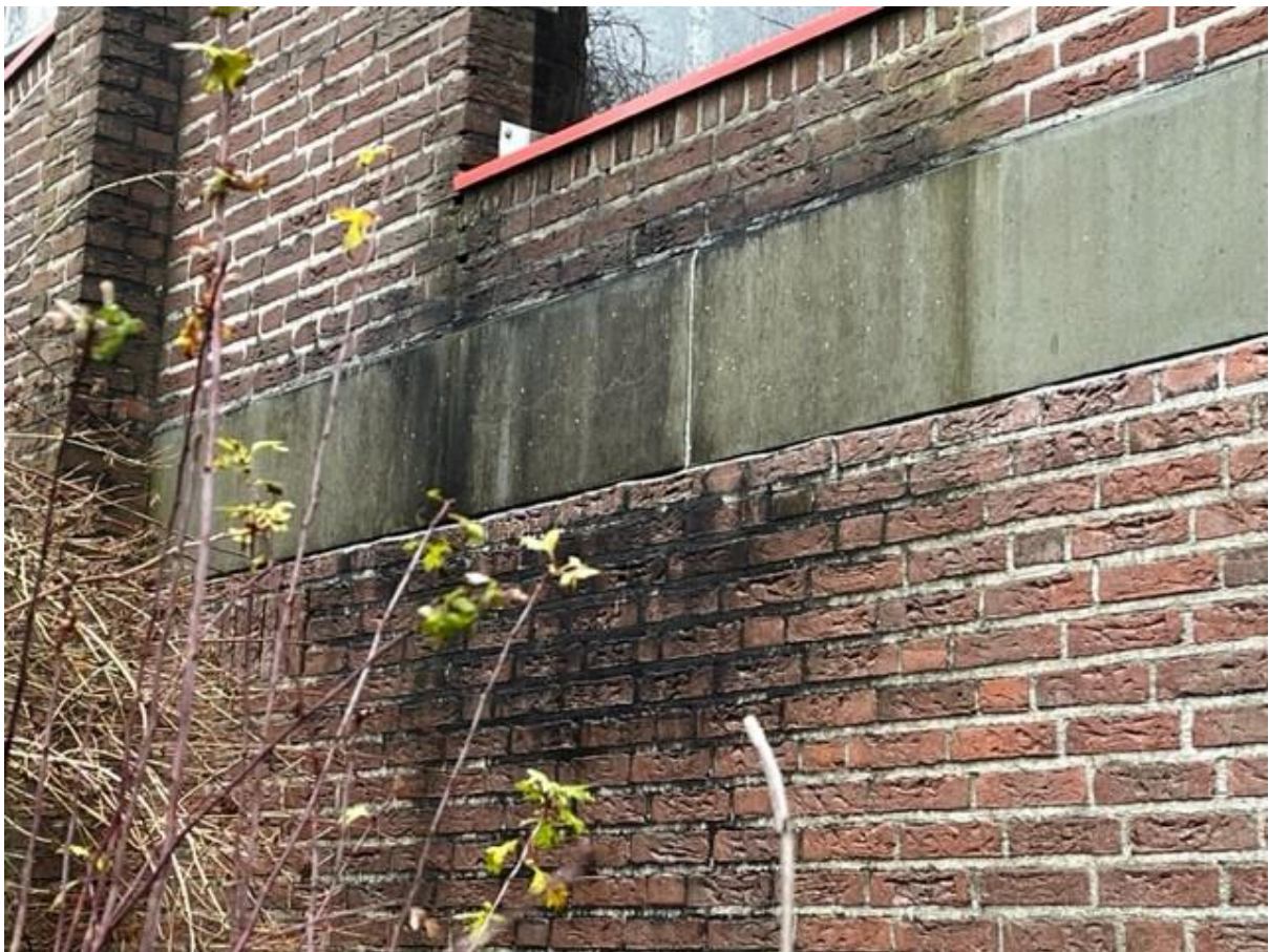
Figuur 9, vervuiling metselwerk en uitgespoeld voegwerk