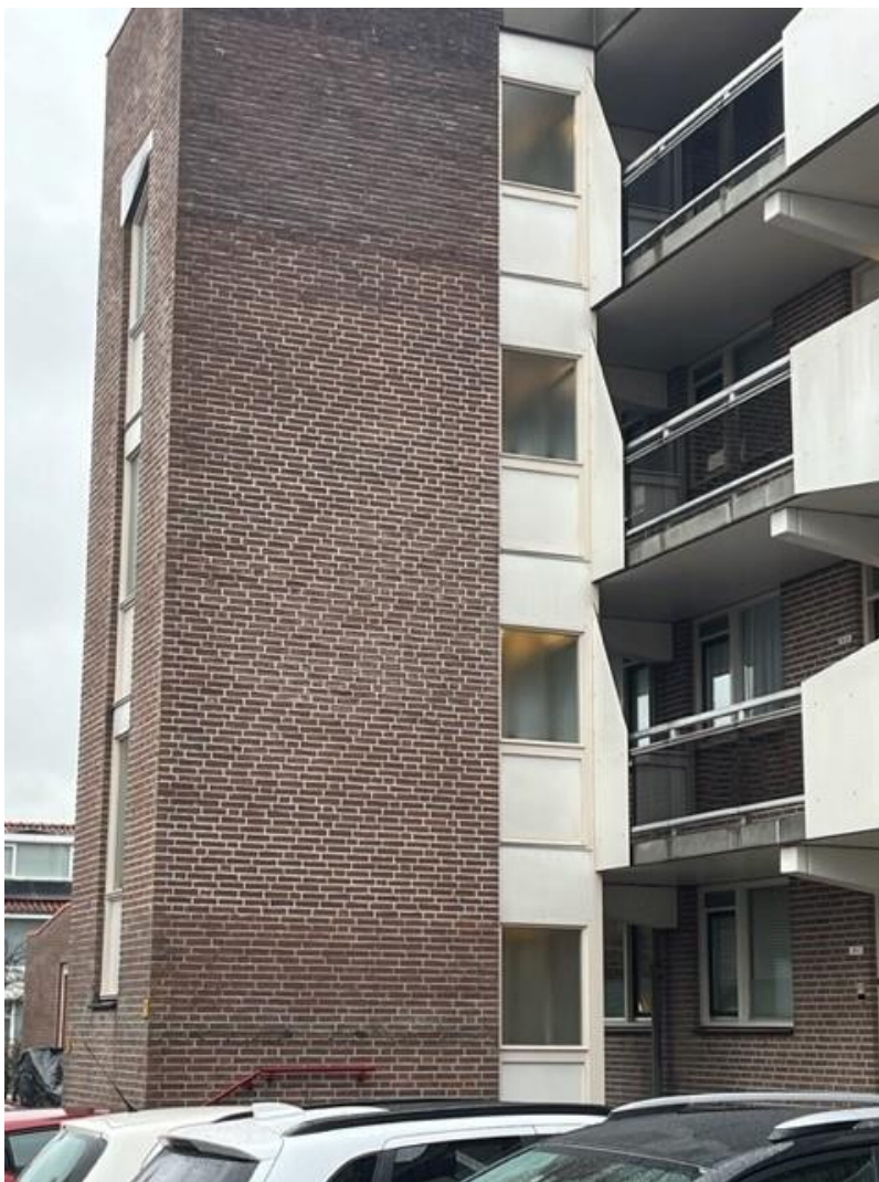
Figuur 1, gevelkozijnen met paneelvullingen trappenhuis