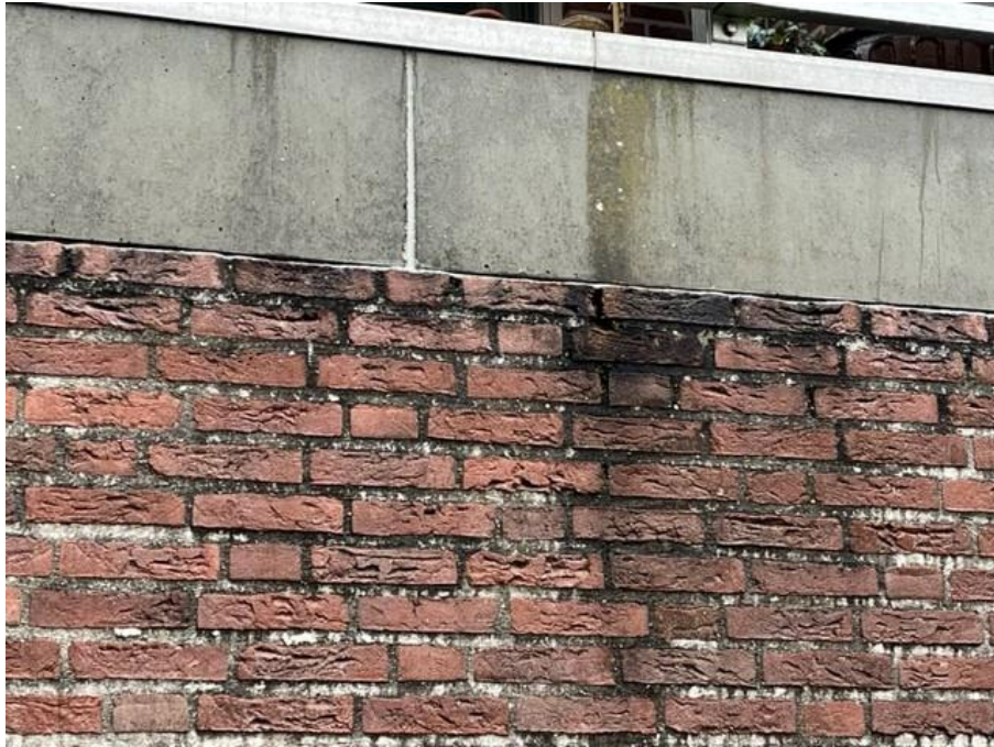
Figuur 8, uitgespoeld voegwerk en matig kitwerk dilatatievoegen