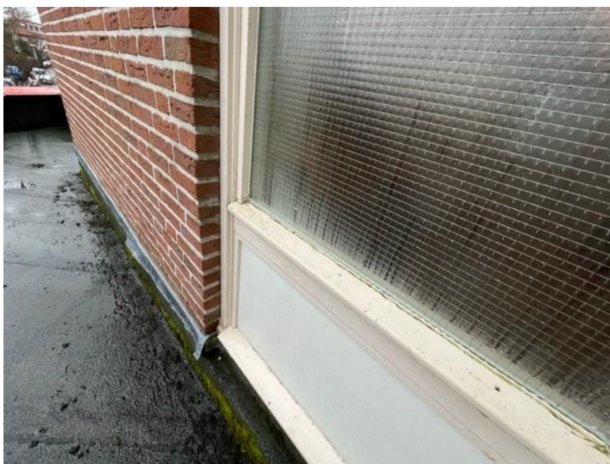
Figuur 5, onderdorpels in een matige onderhoudstoestand