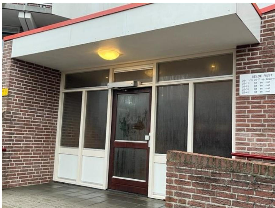
Figuur 2, algemene entree, uitvoeren schilderwerk 2-zijdig