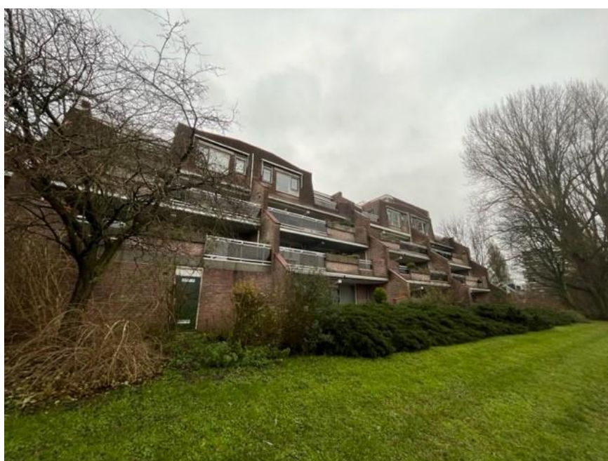
Figuur 7, overzicht achtergevel met dakterrassen