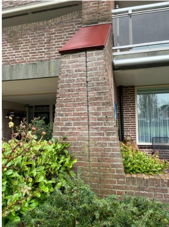
Figuur 10, geveldilatatie achtergevel