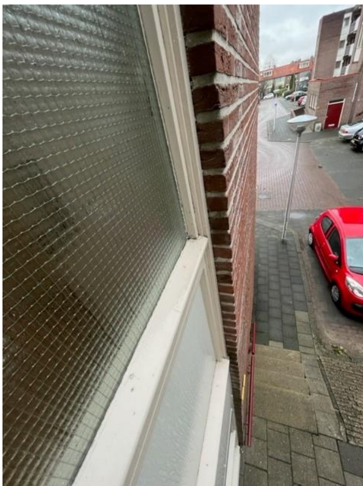
Figuur 4, onderdorpels kozijnen trappenhuis