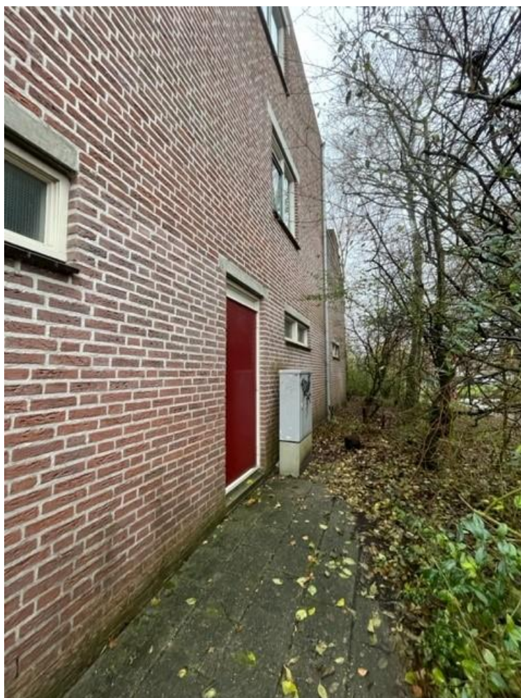
Figuur 6, kopgevel