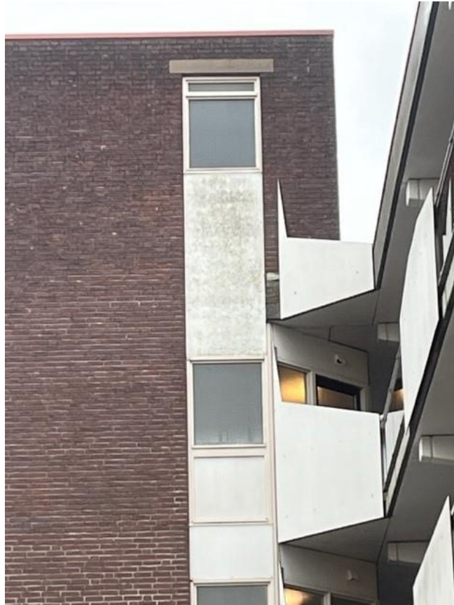
Figuur 3, puivullingen trappenhuis