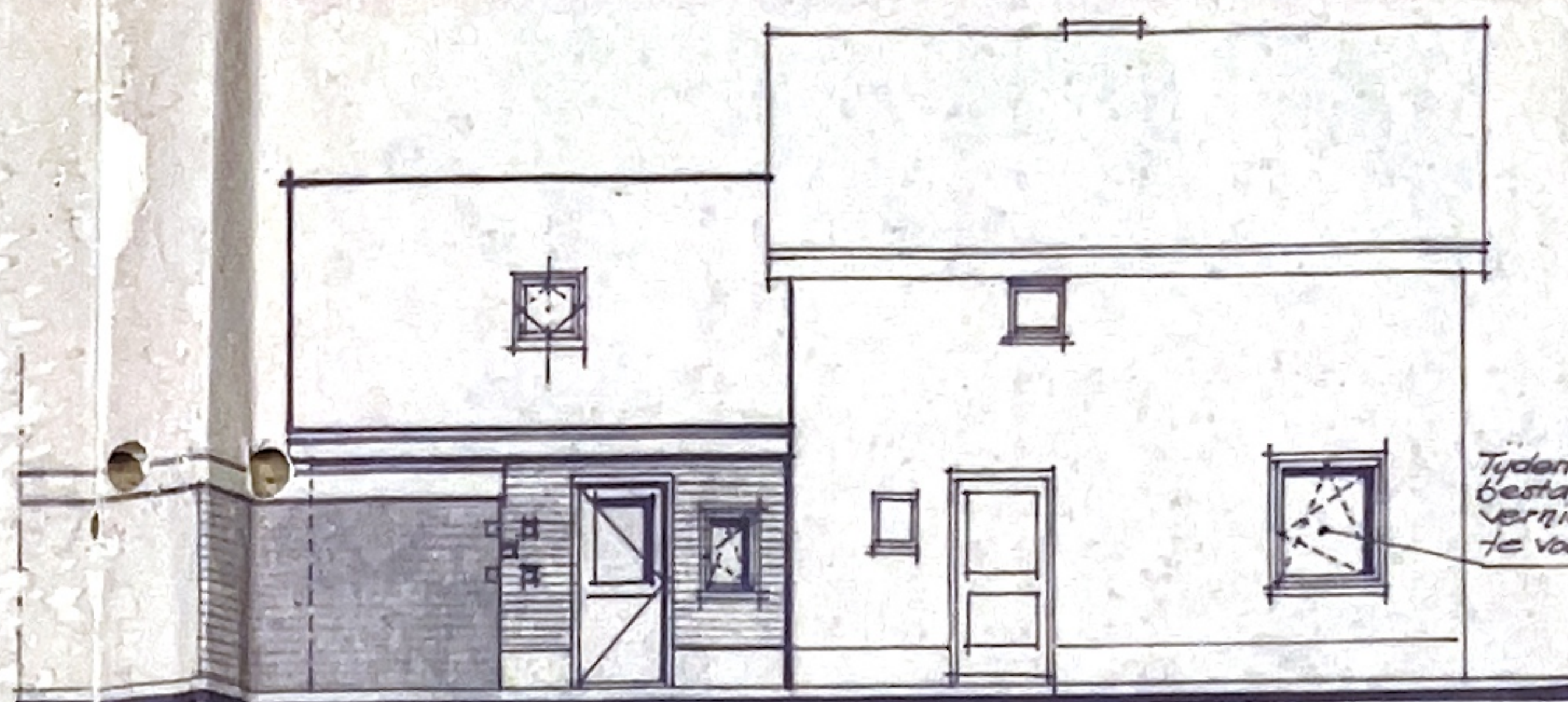
L. Zijkant. na verbouwing.

Tijdens verbouwen bestaand kozijn met verhuur en wel uit te voeren als draai-kiep